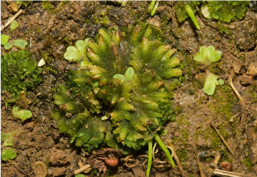
Abb. 1. Notothylas orbicularis (mit Riccia -Arten und Anthoceros agrestis )