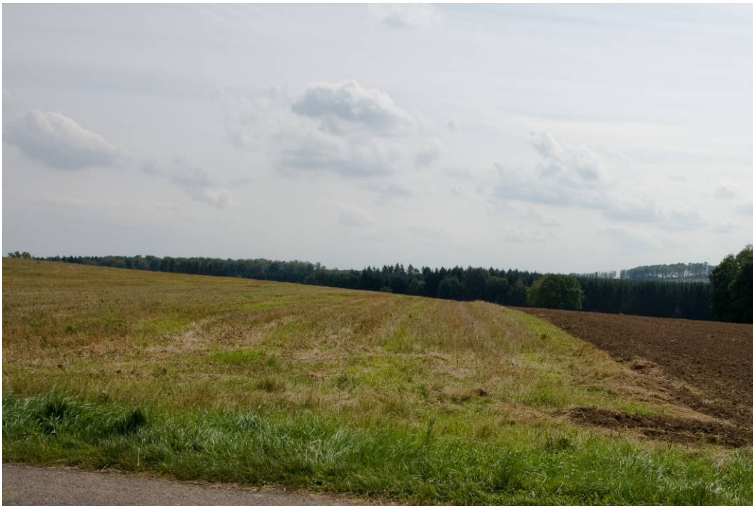
Abb. 2. Notothylas orbicularis und andere Ackermoose entwickeln sich im Herbst auf ungepflügten Getreideäckern (links). Auf gepflügten Äckern (rechts) wachsen keine Ackermoose mehr.